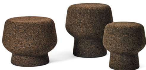
Corker No. 2, No. 3, No. 1