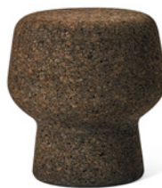
Corker No. 3