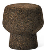
Corker No. 1

Taburete o mesa auxiliar. Corcho oscuro impermeabilizado labrado en una pieza.