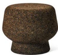
Corker No. 2