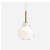
VL Ring Crown 1