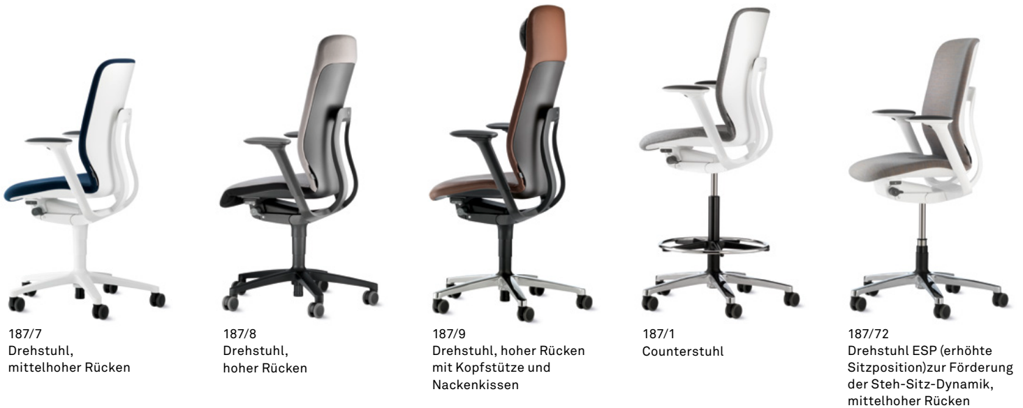
187/7 Drehstuhl, mittelhoher Rücken

Die Armlehnen lassen sich per Tastendruck um 100 mm in der Höhe anpassen. Optional sind die Armauflagen um 50 mm in der Tiefe und je 25 mm in der Breite verschiebbar (3-D-Funktion) und zusätzlich um 25° nach außen oder innen drehbar (4-D-Funktion).